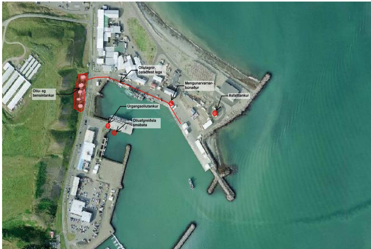
Mynd 2: Sauðárkrókur