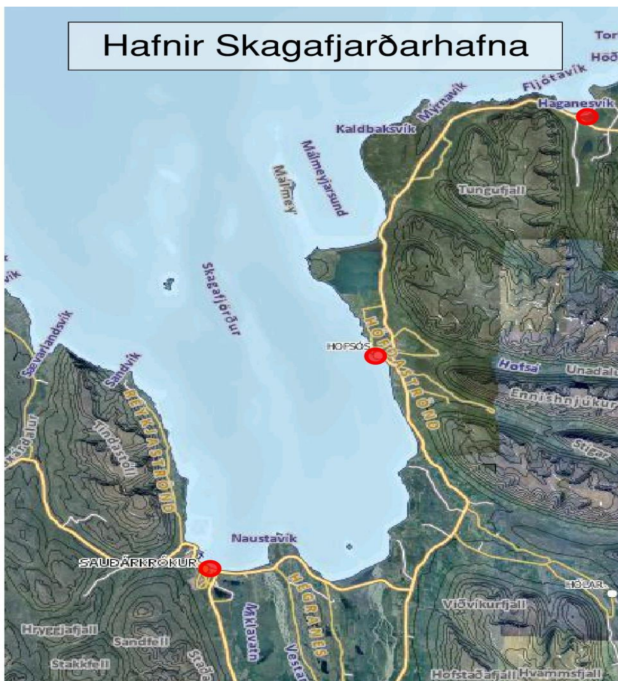
Mynd 1. Yfirlitsmynd sem sýnir allt skilgreint hafnarsvæði Skagafjarðarhafna.

Eftirfarandi myndir veita yfirlit yfir hafnir Skagafjarðarhafna og tilheyrandi hafnarsvæði. Inná þær er merkt staðsetning mannvirkja og búnaðar sem mengunarhætta getur stafað af, auk þess sem viðkvæm svæði og staðsetning mengunarvarnabúnaðar hafnanna er sýnd.